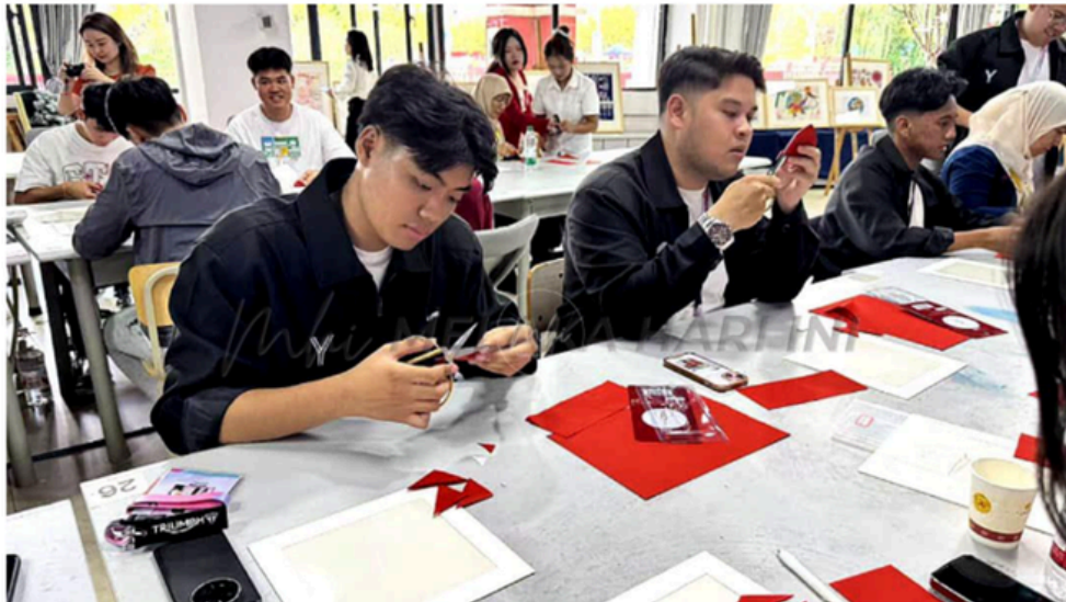
ANTARA aktiviti yang dilaksanakan oleh pelajar PMM sepanjang program itu.

“Selain itu, delegasi turut mengadakan lawatan ilmiah dan budaya ke Muzium Geologi Guiyang dan Balinghe Bridge Museum, memberi peluang peserta meneroka keunikan infrastruktur serta sejarah tempatan China,” katanya kepada Melaka Hari Ini.