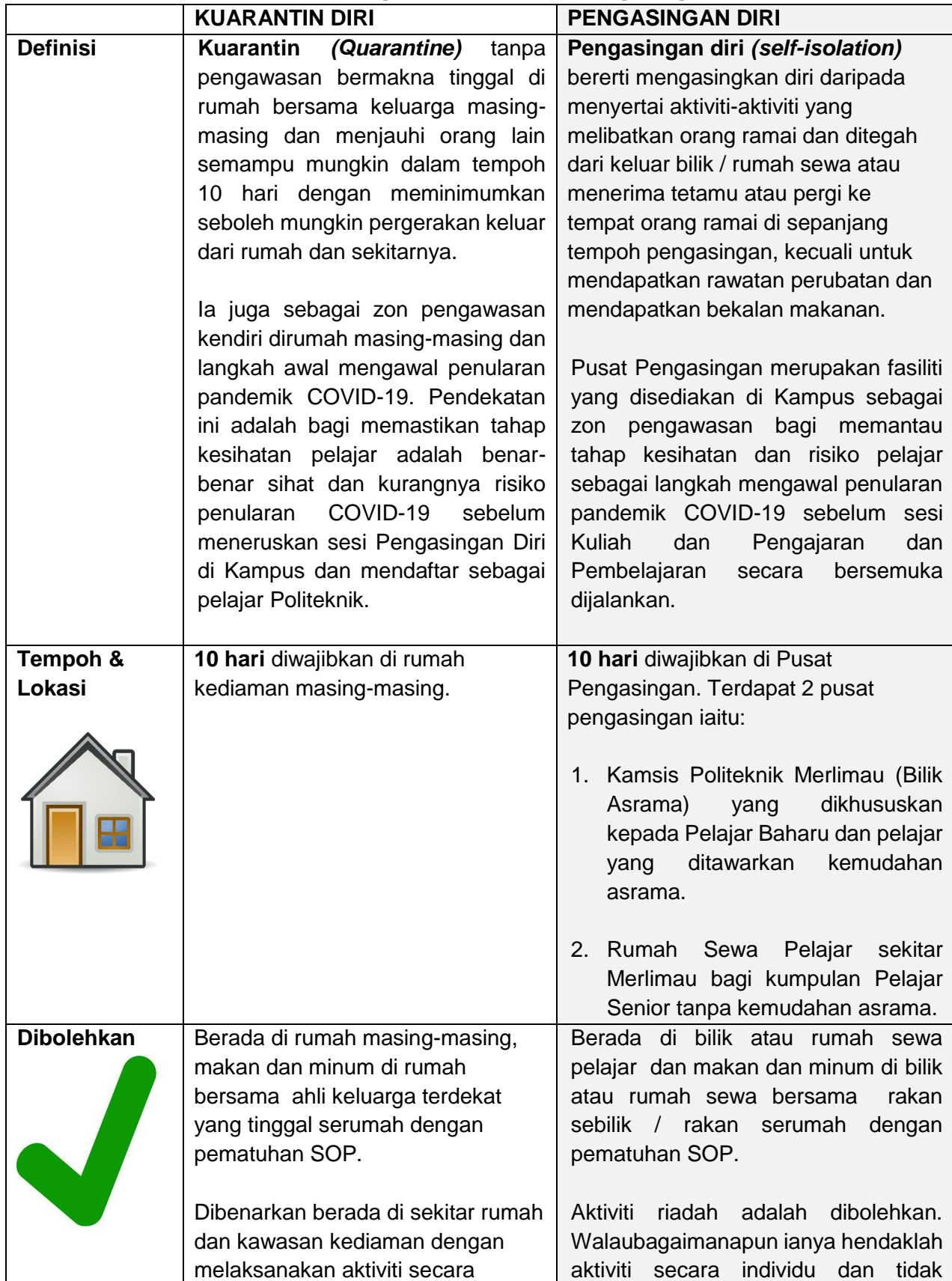
Jadual : Penerangan Kuarantin dan Pengasingan Diri