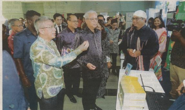
ISMAIL Sabri Yaakob melawat pameran dalam Majlis Pelancaran Pelan Induk Taman Mranti dan Penjenamaan Baharu Mimos Bhd. di Mranti Park Bukit Jalil, semalam.

"Ini bermakna negara memerlukan sebuah taman teknologi yang menjadi titik pertemuan pemegang taruh antaranya inovator, penyelidik dan pelabur bagi mengukuhkan ekosistem