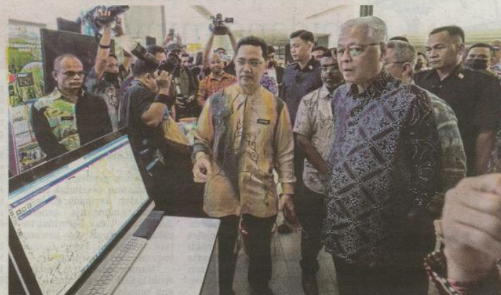
Ismail Sabri melawat pameran inovasi pada Majlis Pelancaran Pelan Induk Taman MRANTI dan penjenamaan semula MIMOS Berhad kepada MIMOS Global di MRANTI Park, Kuala Lumpur, semalam.

"Taman MRANTI ini adalah hab inovasi terunggul di Mala-