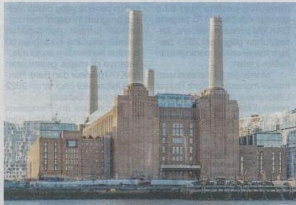
Projek pembangunan semula Battersea Power Station bukan sahaja dibida oleh syarikat Malaysia, malah turut dilakukan syarikat antarabangsa lain.

Semasa lawatan khas ke United Kingdom (UK) tahun lepas, Al-Sultan Abdullah menzahirkan rasa bangga dengan keupayaan serta kejayaan syarikat milik Malaysia dan agensi kerajaan yang menjalankan per-