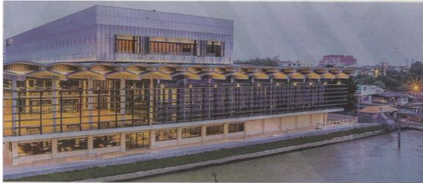
BANK Pusat Thailand dijangka turut menaikkan kadar faedah dalam usaha mengekang peningkatan inflasi di negara berkenaan. - GAMBAR HIASAN

UTUSAN | BANK DIJANGKA NAIKKAN KADAR FAEDAH 2H22 | MS 37