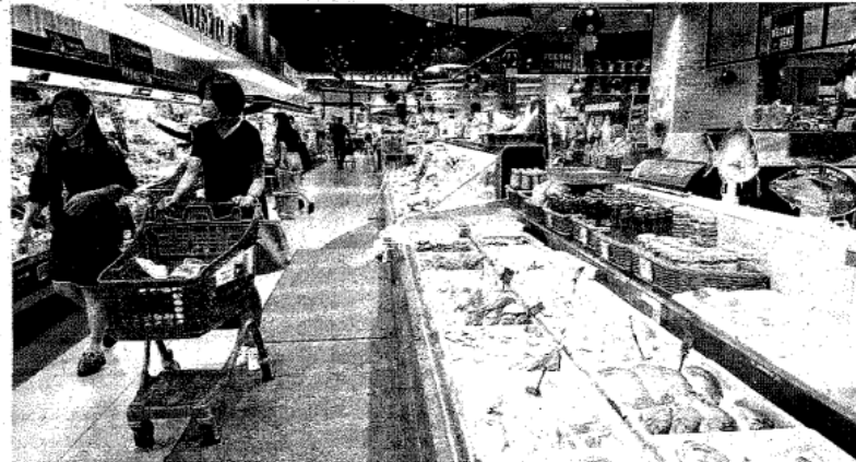
KENAIKAN harga makanan mendorong peningkatan kadar inflasi negara pada Julai 2022 ke paras tertinggi dalam tempoh lebih setahun. - GAMBAR HIASAN

"Peningkatan inflasi Malaysia pada Julai turut disebabkan oleh kesan asas yang lebih rendah pada tahun lalu berikutan pemberian diskaun bil elektrik dari lima hingga 40 peratus mengikut jumlah penggunaan kepada pengguna domestik di bawah