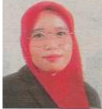
Pengarah Institut Latihan Perindustrian (ILP) Pedas

Oleh Suhaila Abdul Samad bhrencana@bh.com.my