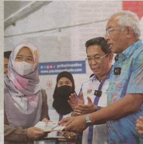
Mahdzir menyampaikan sumbangan kepada pelajar ketika merasmikan program JPKM Parlimen Jelebu, semalam.

Terdahulu Mahdzir berucap pada program JPKM Peringkat Parlimen Jelebu yang turut dihadiri Timbalan Menteri Wilayah Persekutuan, Datuk Seri Jalaluddin Alias merangkap Ahli Parlimen Jelebu serta Ketua Pe-