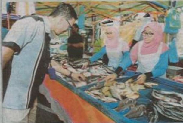
Graduan harus menimba sebanyak mungkin ilmu keusahawanan bagi memastikan mereka dapat kekal bersaing dalam perniagaan diceburi. (Foto hiasan)

Graduan perlu sedar pihak berwajib dan pelbagai institusi kewangan turut aktif membuka peluang bagi mereka menjalani kursus atau pinjaman perniagaan.