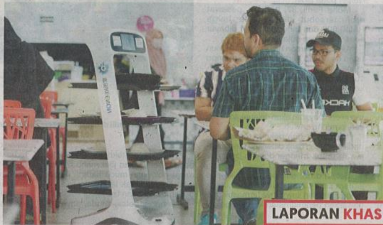
Tugas menghantar makanan atau minuman diambil oleh robot-robot sekali gus mengurangkan kebergantungan kepada pekerja.