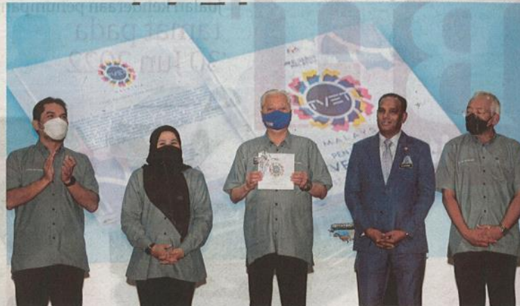
Ismail Sabri melancarkan Buku Penjenamaan Pendidikan Teknikal dan Latihan Vokasional (TVET) pada Majlis Perasmian Minggu TVET Negara (MTN) di Politeknik Sultan Salahuddin Abdul Aziz Shah, di Shah Alam, semalam.

"Bilangan pelajar aliran vokasional dan teknikal di negara