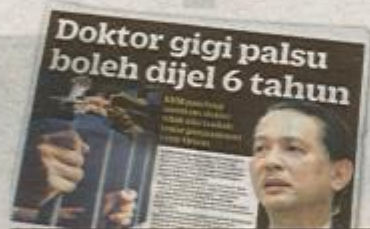
KERATAN Kosmo! 14 Februari 2022.

"Golongan muda khususnya pelajar IPT di Lembah Klang dikesan paling ramai menjadi mangsa