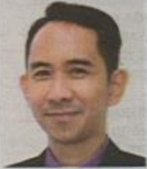
Pensyarah Jabatan Pengurusan Perniagaan, Kolej Profesional MARA Beranang

Oleh Dr Sharul Azlan Maulod bhrencana@bh.com.my