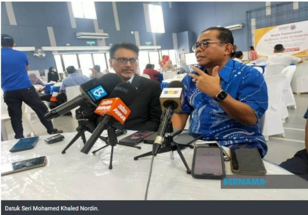
Datuk Seri Mohamed Khaled Nordin.

JOHOR BAHRU, 25 Feb (Bernama) -- Kementerian Pendidikan Tinggi (KPT) sedang mengkaji untuk memperkenalkan sistem anjal pembelajaran dari rumah, bagi membantu mengurangkan pinjaman pelajar Institut Pengajian Tinggi Awam (IPTA).