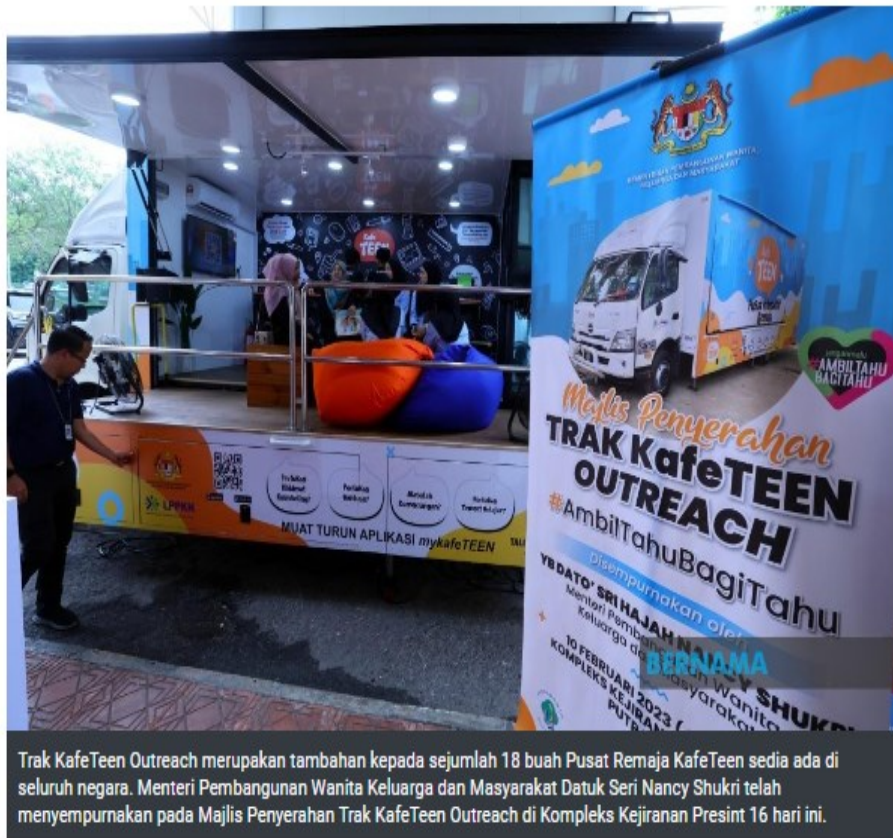
Trak KafeTeen Outreach merupakan tambahan kepada sejumlah 18 buah Pusat Remaja KafeTeen sedia ada di seluruh negara. Menteri Pembangunan Wanita Keluarga dan Masyarakat Datuk Seri Nancy Shukri telah menyempurnakan pada Majlis Penyerahan Trak KafeTeen Outreach di Kompleks Kejiranan Presint 16 hari ini.

Beliau berkata kempen itu bertujuan memupuk jati diri remaja melalui penghayatan nilai 'KASIH' iaitu kasih sayang; akhlak; sihat dan selamat; berilmu; dan harmoni bagi mengelakkan mereka daripada terlibat dalam aktiviti tidak bermoral.