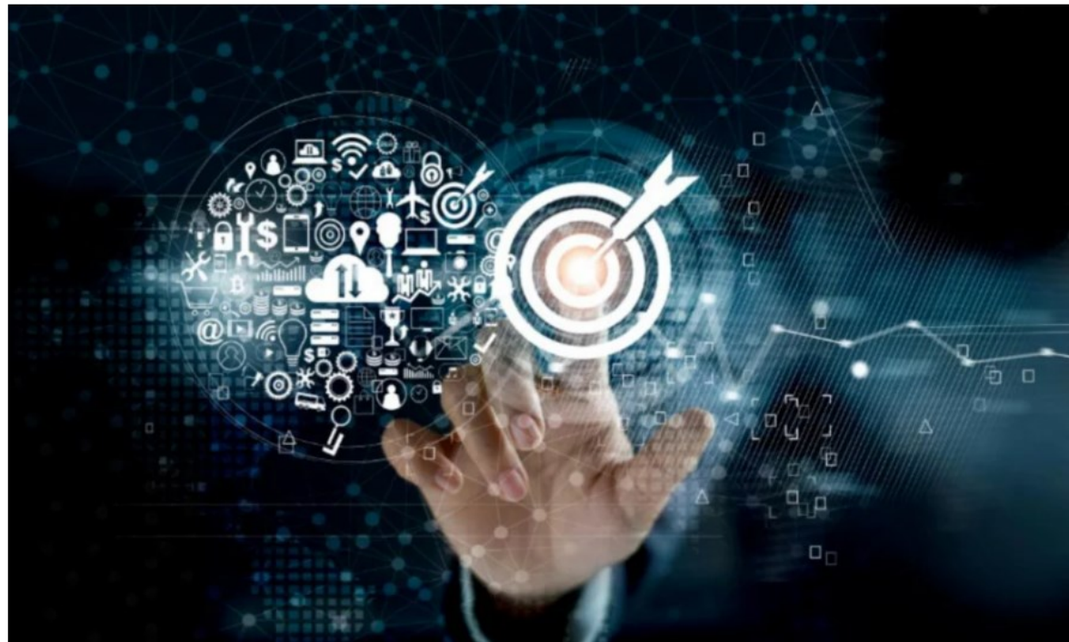
- Gambar hiasan