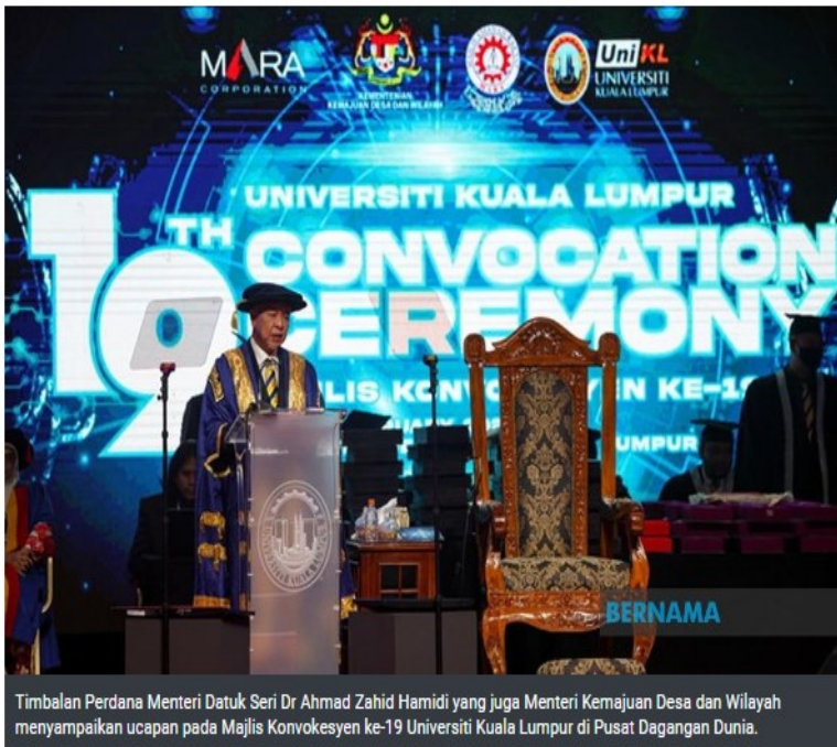
Timbalan Perdana Menteri Datuk Seri Dr Ahmad Zahid Hamidi yang juga Menteri Kemajuan Desa dan Wilayah menyampaikan ucapan pada Majlis Konvokesyen ke-19 Universiti Kuala Lumpur di Pusat Dagangan Dunia.

“Jangan ada prasangka bahawa mereka dianggap drop out atau tercicir dalam bidang akademik dan masuk ke bidang TVET ini, tiada peluang dan masa depan. UniKL telah membuktikan bahawa mereka adalah aset negara dan mampu untuk cemerlang,” katanya.