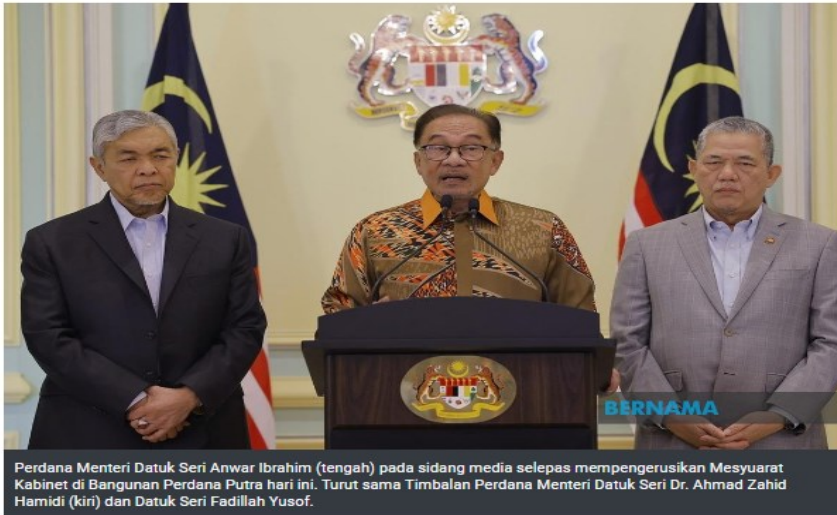
Perdana Menteri Datuk Seri Anwar Ibrahim (tengah) pada sidang media selepas mempengerusikan Mesyuarat Kabinet di Bangunan Perdana Putra hari ini. Turut sama Timbalan Perdana Menteri Datuk Seri Dr. Ahmad Zahid Hamidi (kiri) dan Datuk Seri Fadillah Yusof.