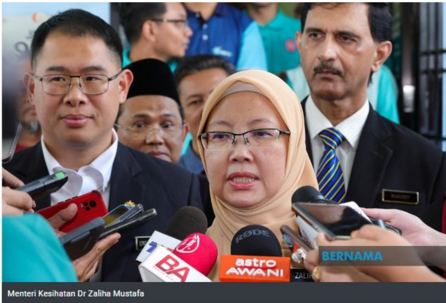
Menteri Kesihatan Dr Zaliha Mustafa