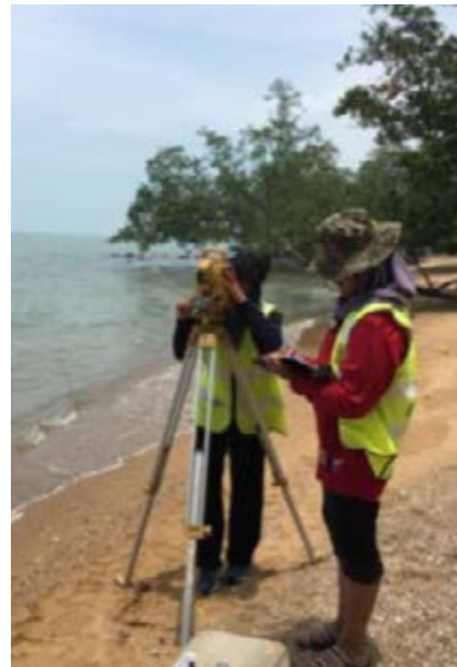
Gambar 2: Persediaan awal sebelum memulakan kerja ukur.