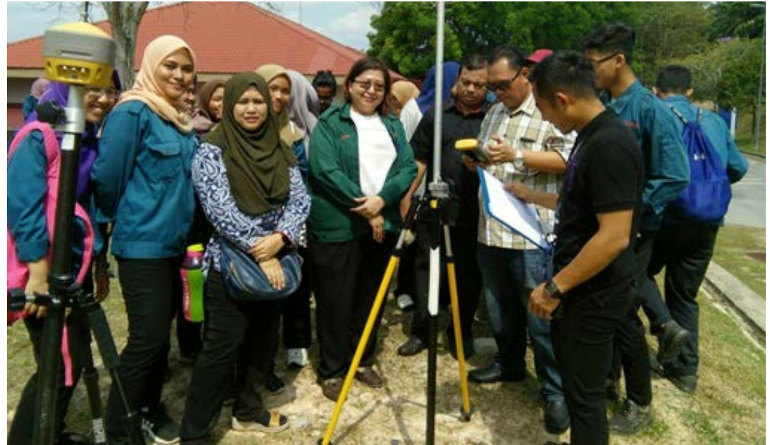
Gambar 2: Amali penggunaan alat GNSS di lapangan