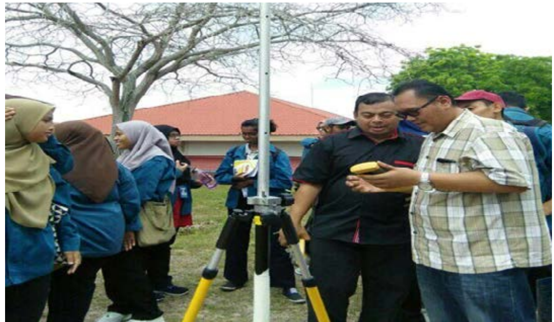
Gambar 3: Amali penggunaan alat GNSS di lapangan