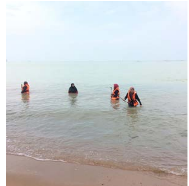
Gambar 3: Kerja-kerja ukur hidrografi sepanjang jeti pantai Pengkalan Balak.