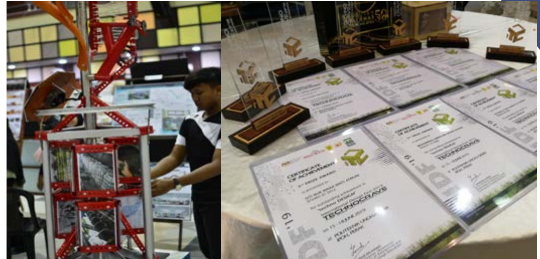
Antara hasil karya pelajar dan senarai award yang telah dimenangi?

Ribuan terima kasih juga diucapkan kepada Ketua Jabatan Kej. Awam, Kpro Senibina dan semua pensyarah senibina PMM yang terlibat secara langsung dan tidak langsung. Syabas Senibina PMM.