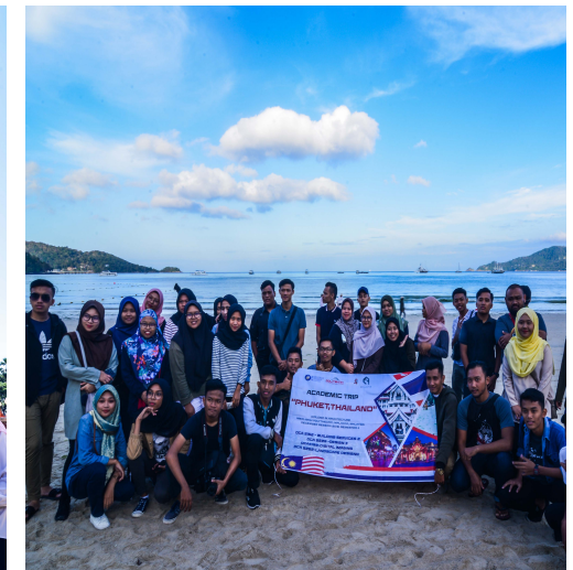
Barisan pelajar dan pensyarah bersama-sama menimba ilmu di Universiti Rajabath dan sekitar Phuket, Thailand