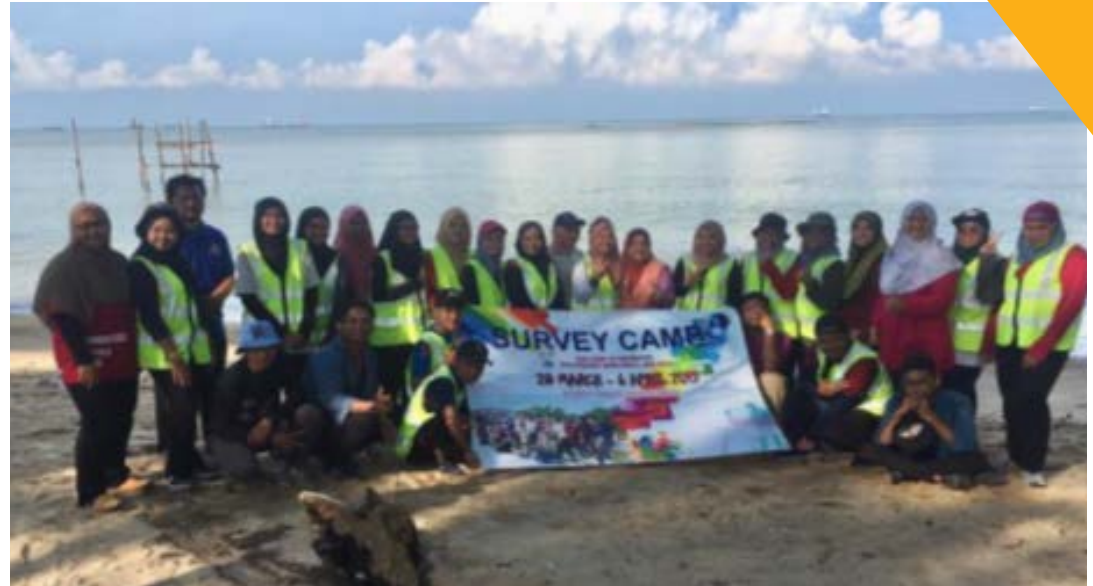
Gambar 1: Pensyarah, konsultan dan pelajar yang terlibat dalam Program Latihan Khemah Ukur.

Selain daripada itu, kerja-kerja hidrografi turut dijalankan di sekitar pantai Kuala Linggi melibatkan kerja-kerja seperti cerapan pasang surut, pemindahan datum, kutipan data topografi, proses pemeruman (sounding) dan penghasilan carta Batimetri. Juruukur Perunding telah dilantik sebagai konsultan untuk mengendalikan kerja-kerja hidrografi di sepanjang pantai Pengkalan Balak kerana mempunyai peralatan yang bersesuaian dan berpengalaman luas dalam kerja-kerja sebenar berkaitan bidang hidrografi. Kesimpulannya, program ini telah berjalan dengan lancar dan memberikan manfaat yang berguna kepada para pelajar. Pelajar telah didedahkan dengan kerja sebenar di lapangan berkaitan dengan kerja-kerja pengukuran kejuruteraan, kadaster dan hidrografi untuk meningkatkan kemahiran serta keyakinan para pelajar dalam menyelesaikan permasalahan di padang dengan suasana pembelajaran yang berbeza.