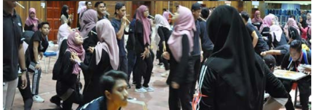
Sesi bergambar pensyarah dan pelajar DKA bersama ketua jabatan dan gambar aktiviti pada hari DKA DAY