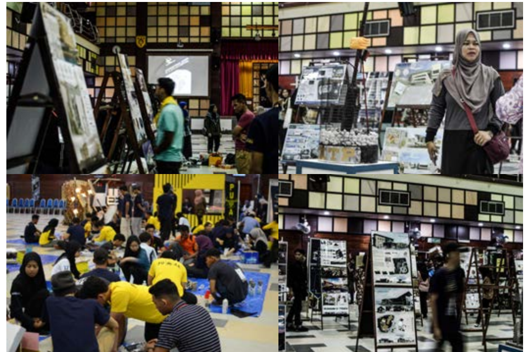
Gambar peserta@pelajar senibina Politeknik Malaysia dalam pertandingan IDF2019