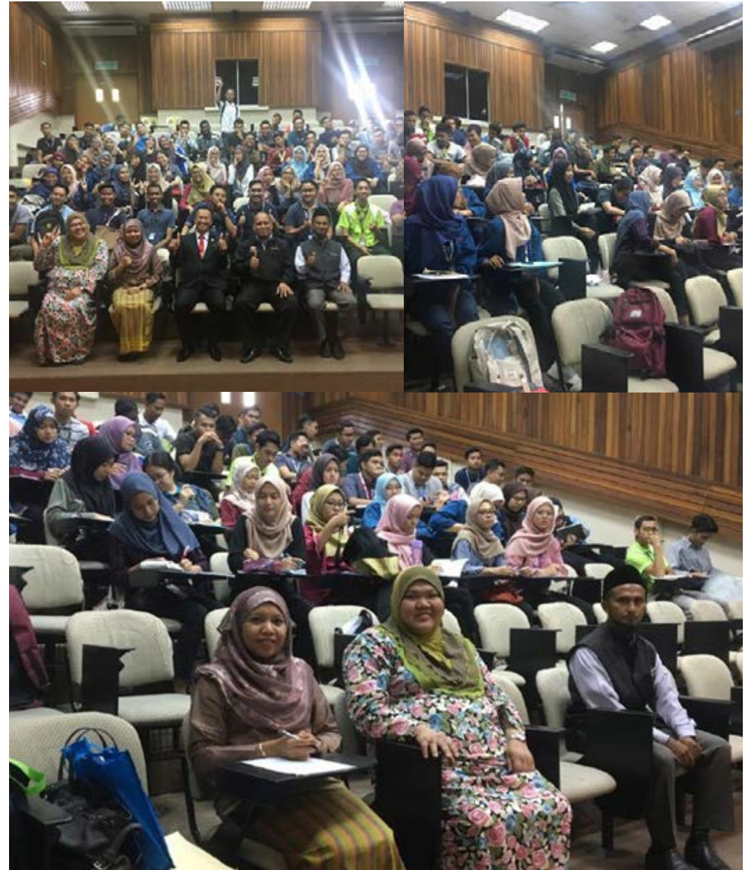
Barisan pensyarah dan pelajar tekun mendengar pendedahan ilmu daripada pegawai daripada Jabatan Kerja Raya Johor