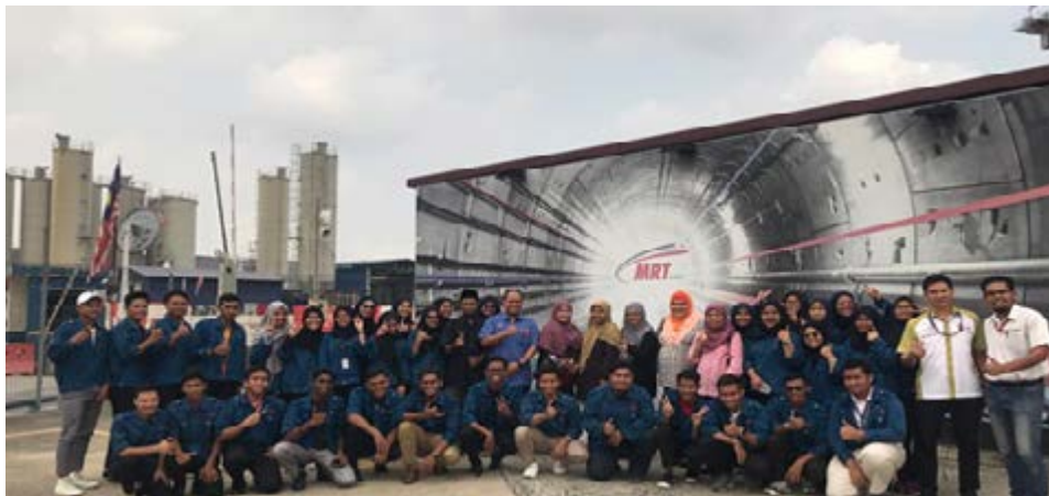
Gambar 1: Bergambar kenangan di hadapan Pusat Informasi MRT.

Selain itu, para pelajar didedahkan tentang maklumat mengenai teknologi kereta api dan jenis stesen yang dibina untuk laluan MRT Bandar Utara Malaysia. Selepas mendengar penerangan di Pusat Informasi MRT, pelajar dapat merasai keterujaan menaiki MRT daripada Stesen KL Sentral ke Kajang. Semua peserta lawatan dan pensyarah terlibat telah mendapat manfaat selepas menghadiri lawatan ini.