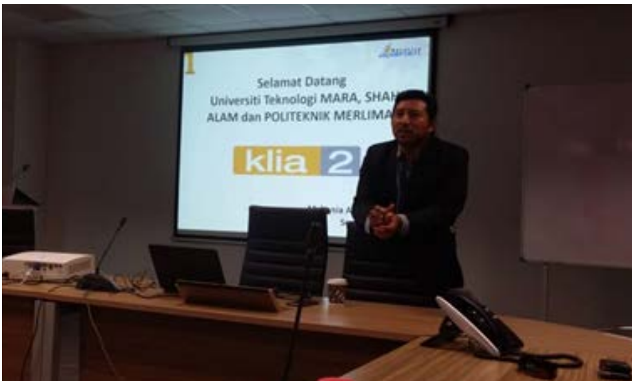
Gambar 1: Taklimat diberikan oleh Jurutera Kanan Malaysia Airport Sdn. Bhd. kepada pelajar

Semasa di lokasi, penerangan tentang projek telah disampaikan oleh Jurutera yang terlibat dengan pembinaan terminal di KLIA2. Pelajar didedahkan kepada proses pembinaan turapan khusus untuk landasan kapal terbang dan kerja penyelenggaraan. Pelajar juga melawat sekitar KLIA2 dan mengambil gambar sebagai kenangan. Lawatan di KLIA2 telah memberi inspirasi kepada pelajar untuk berjaya dan dapat memberi manfaat kepada diri dan negara.