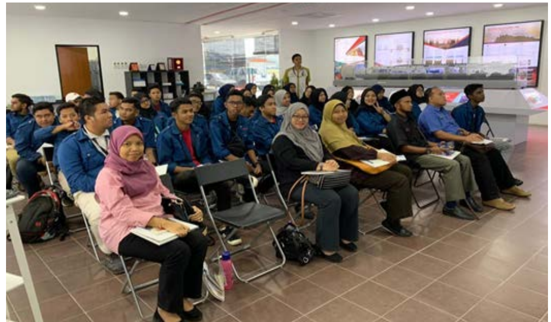
Gambar 3: Taklimat di Pusat Informasi MRT sebelum meneruskan lawatan.