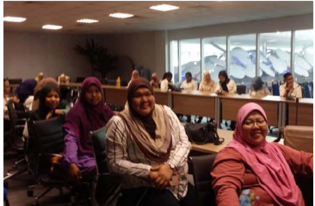
Gambar 2: Pelajar dan pensyarah mendengar taklimat yang disampaikan