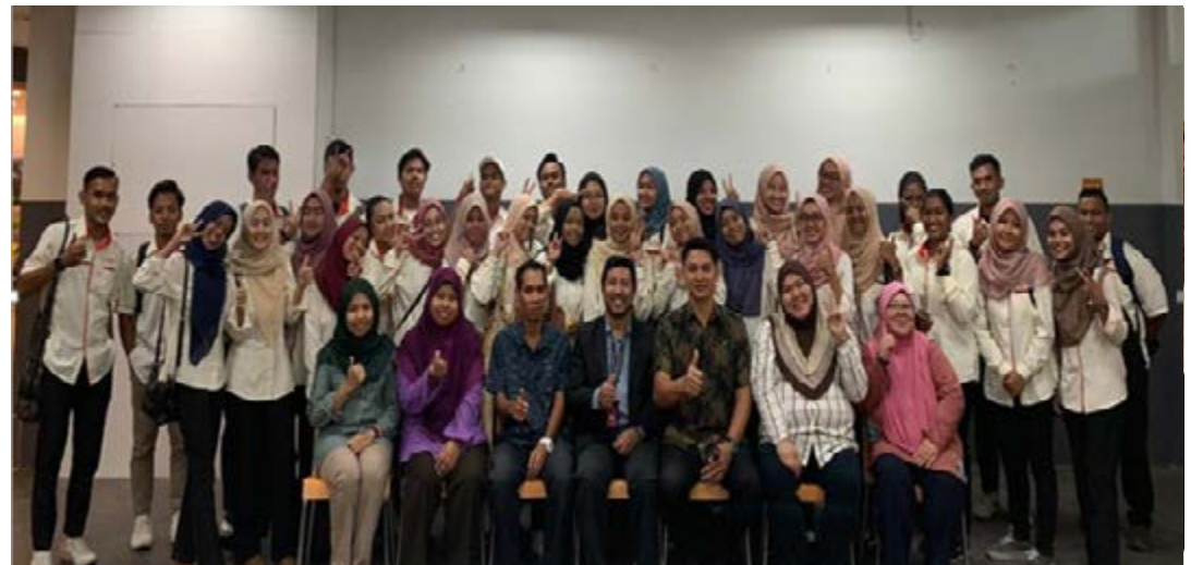
Gambar 3: Bergambar kenangan sebelum meneruskan lawatan ke sekitar KLIA2