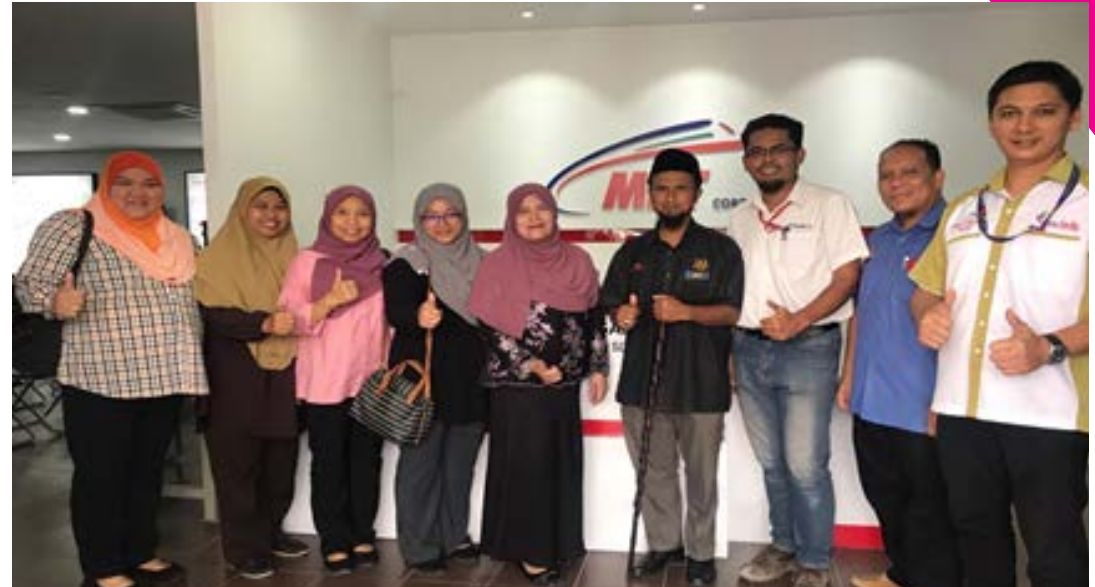
Gambar 2: Pensyarah Pengiring bergambar bersama Jurutera MRT dan Pegawai Perhubungan Awam MRT.