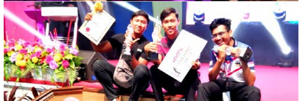
Gambar peserta@pelajar senibina Politeknik Merlimau beserta sijil kemenangan dalam pertandingan fotografi MELAKAARTPEX 2020.