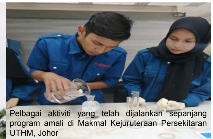
Pelbagai aktiviti yang telah dijalankan sepanjang program amali di Makmal Kejuruteraan Persekitaran UTHM, Johor