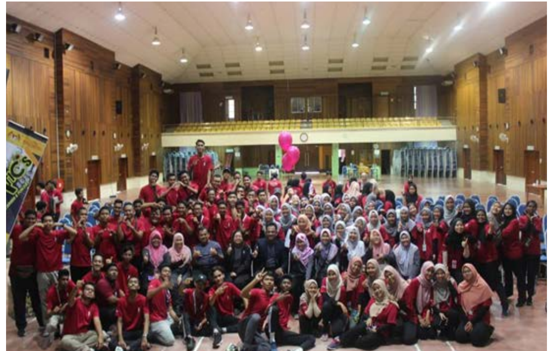
Gambar 2: Sesi bergambar bersama pelajar dan pensyarah setelah program selesai.