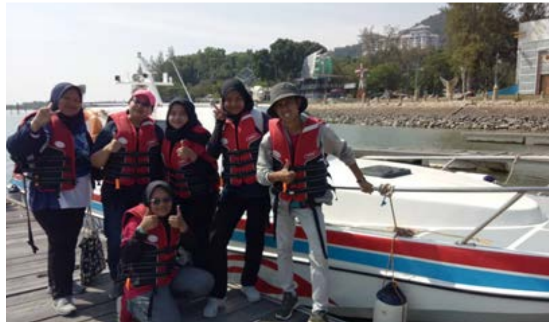
Gambar 3: Sesi bergambar bersama pensyarah yang terlibat.