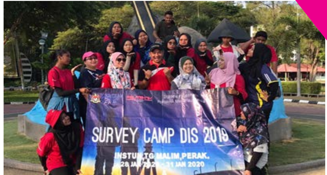
Gambar 2: Pensyarah Pengiring bergambar bersama di Survey Camp Sesi Disember 2019