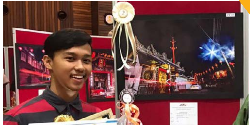
Pelajar senibina semester 4 mendapat tempat kedua pada pertandingan fotografi.

Terima kasih juga kepada Ketua Jabatan Kejuruteraan Awam dan Kpro Senibina serta semua pensyarah senibina atas sokongan dan galakan kepada pelajar.