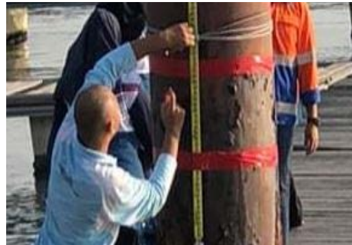
Gambar 1: Antara aktiviti yang dilakukan semasa program dijalankan.