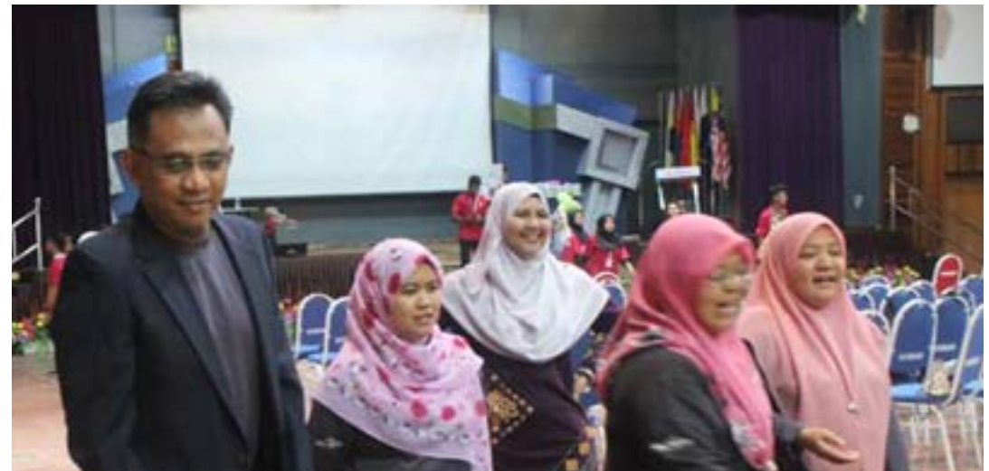
Gambar 3: Sesi bergambar bersama para pensyarah yang terlibat di dalam program ini.