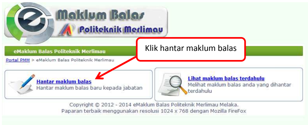
Gambar 1 : Pautan ke borang cadangan/pandangan/maklumbalas.