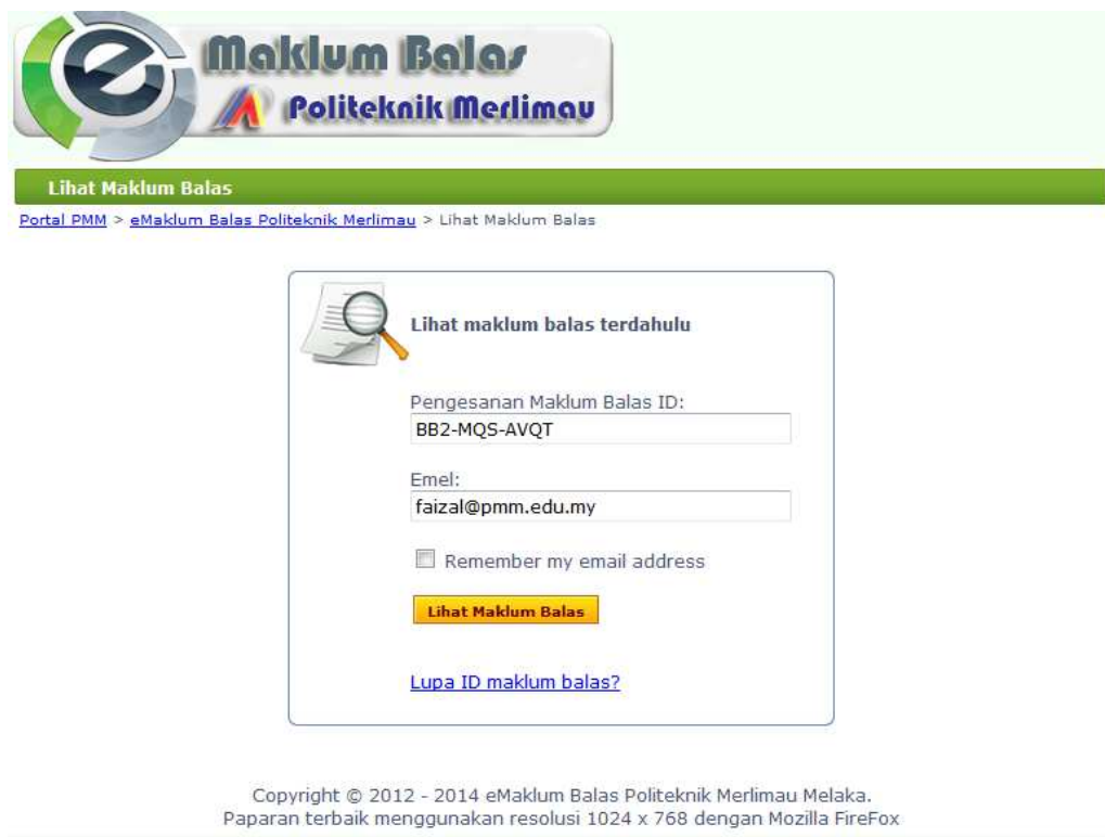
Gambar 5 : Melihat status maklum balas yang dihantar. Isikan ID maklum balas dan alamat emel bagi tujuan tersebut. Klik butang Lihat Maklum Balas.