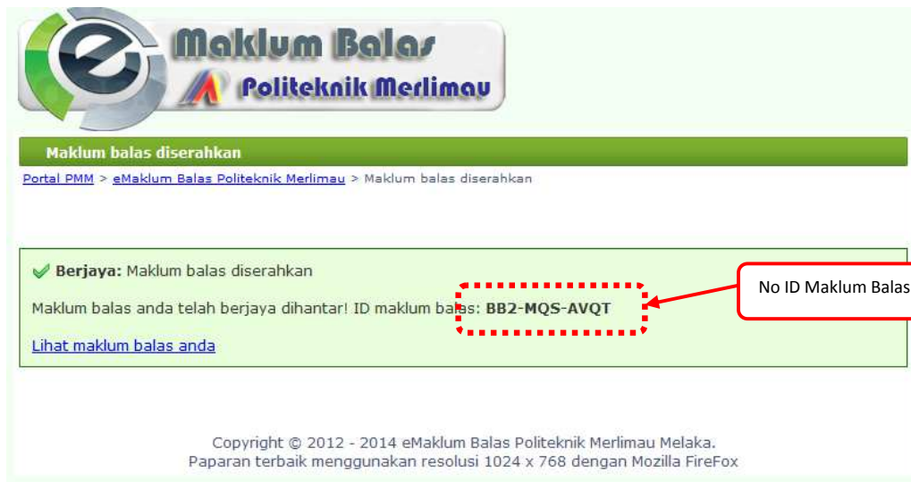
Gambar 4 : Paparan status selepas borang di hantar.