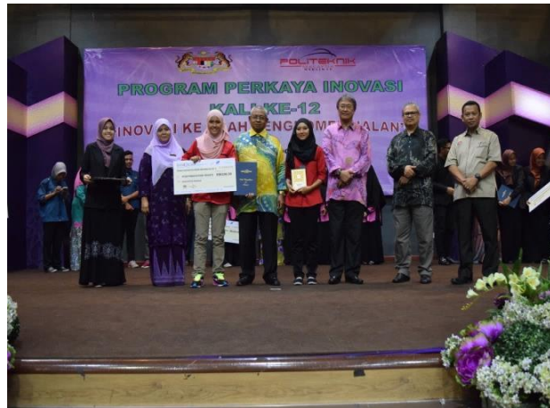
Anugerah Juri Kategori - Rekacipta