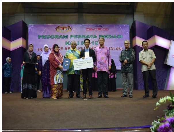
Anugerah Juri Kategori - Rekabentuk