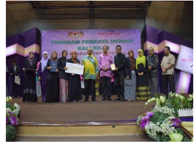
Anugerah Juri Kategori - Penyelidikan