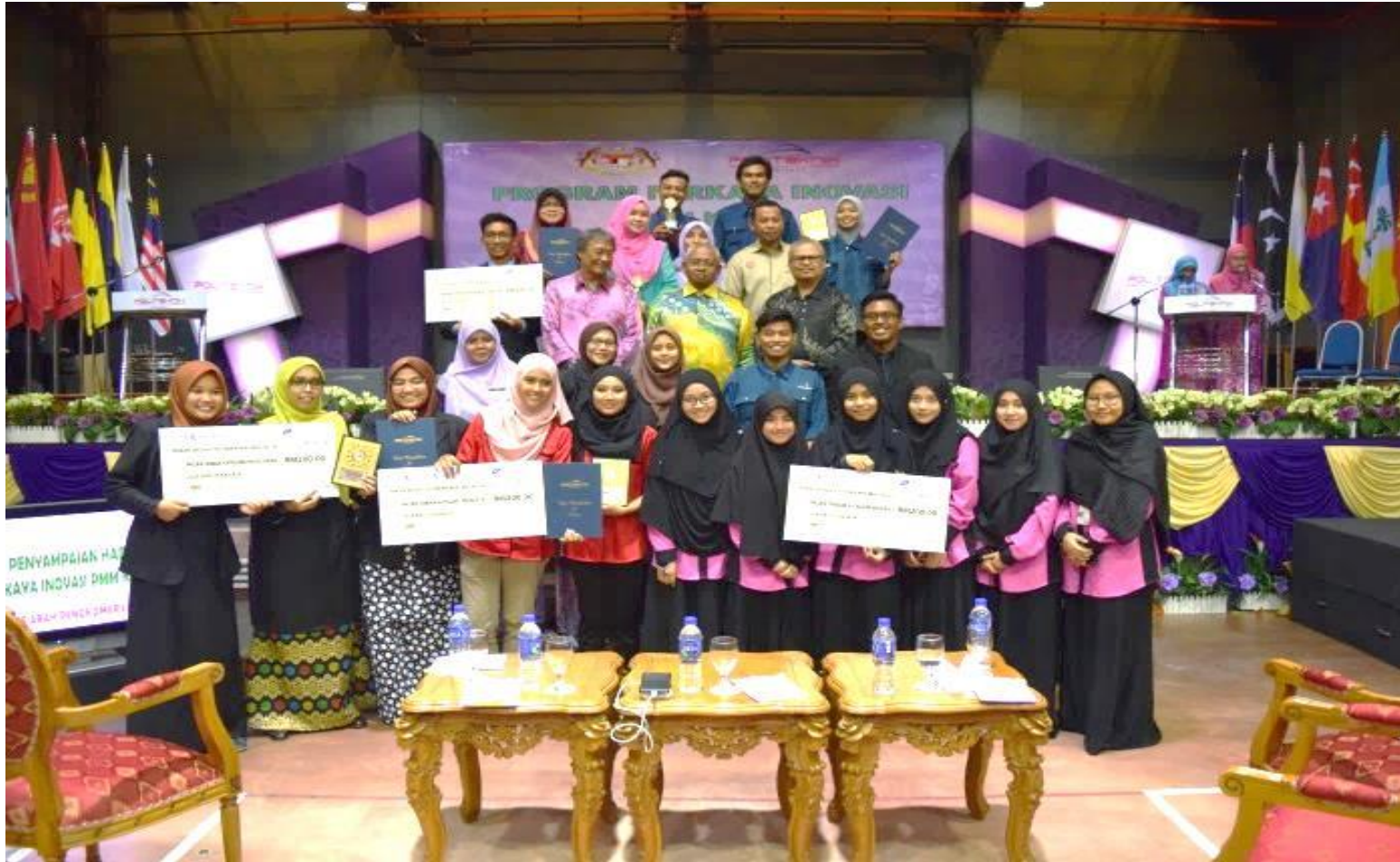
Barisan pemenang Program Perkaya Inovasi Kali Ke-12 Politeknik Merlimau, Melaka

Gambar-gambar sekitar Program PERKAYA 12 :