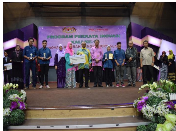
Anugerah Juri Kategori - Inovasi Teknikal