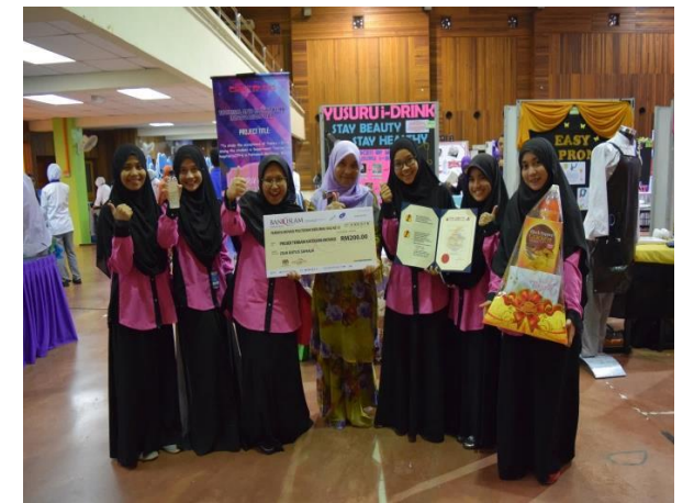
Anugerah Juri Kategori - Inovasi Sosial