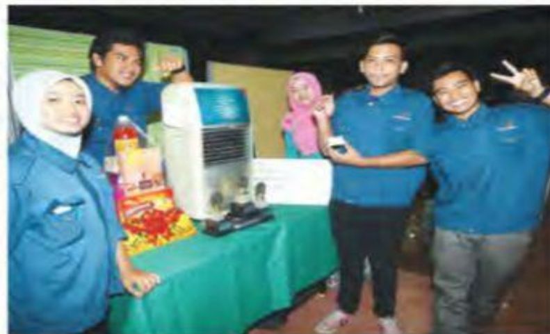
PESERTA kumpulan JK M 2 Politeknik Merlimau bergambar bersama projek Pottier Cooler yang membolehkan kumpulan itu menerima anugerah Pengarah.

projek saja terpilih menerima Anugerah Pengarah iaitu projek yang dirangkul peserta kumpulan JK M 2 sekali gus